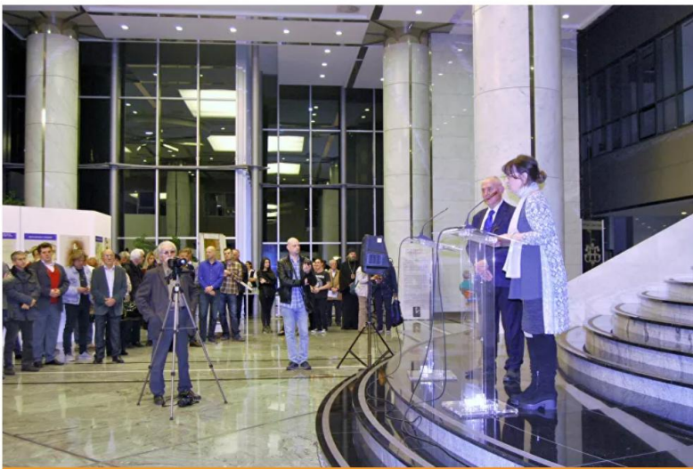
Отварање изложбе „Миланковићева временска капија“ у Народној банци Србије