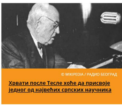
Хрвати после Тесле хоће да присвоје једног од највећих српских научника