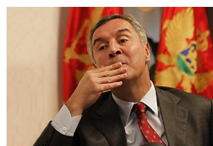
Да ли је Мило на ивици банкрота