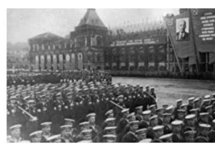
Марш победника: Овако је изгледала Москва 24. јуна 1945. године док је њоме дефиловала Црвена армија