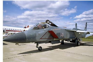
Право у небо: Јак-141 – авион испред свог времена /фото/