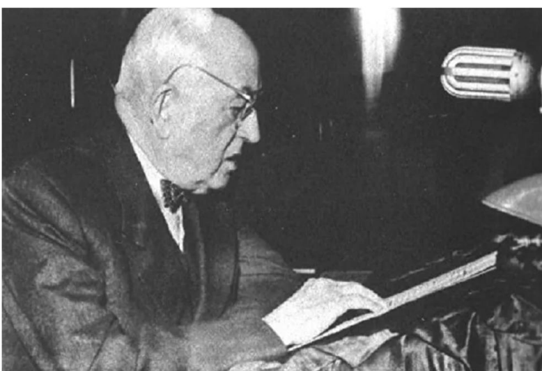
Српски научник Милутин Миланковић