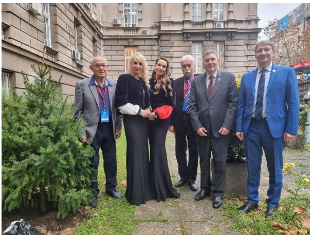
Садња Миланковићевог омиљеног дрвета (Picea omorika) испред зграде Грађевинског факултета у Београду