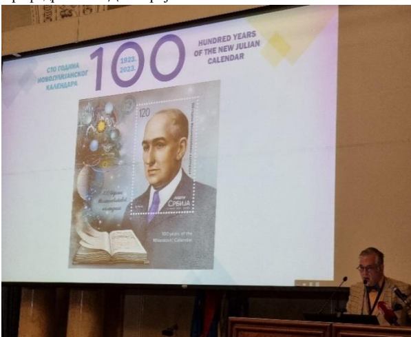
Представљена серија пригодних поштанских марка „Сто година Миланковићевог календара“