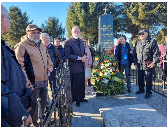
Полагање венца на Миланковићев гроб у Даљу