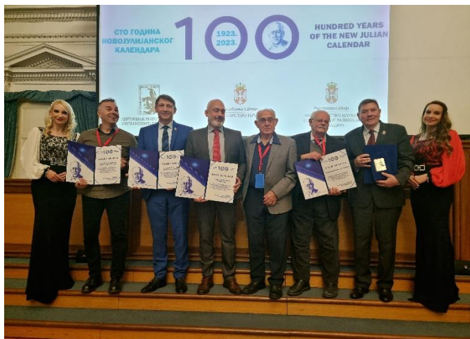
Додела захвалница појединцима и институцијама за помоћ и подршку поводом успешне реализације Међународне конференције