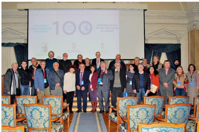
Учесници Међународне конференције

Од 13.00 до 19.30 сати одржане су три сесије на којима је изложено 14 радова. Програм излагања радова дат је у прилогу извештаја.